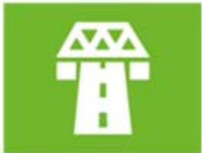
ruimte en infrastructuur